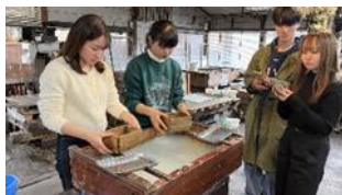
[大町市グローバル発信プロジェクト]