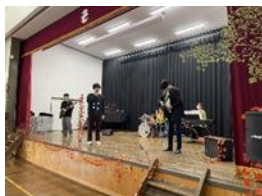
[王滝村推し村プロジェクト]

学生が具体的な地域の企業や自治体のプロジェクトに参加し、大学での学びを実践の中で深める学習（PBL）プログラムを、王滝村（6人参加）・大町市（8人参加）・高山村（28人参加）などにて実施し、学生と地域のステークホルダーとの対話を通じて課題解決プランを実践した。プロジェクト参加後の学生がその後、王滝村・大町市・高山村それぞれで、地域住民と連携し企画した事業やイベントを実施・計画している。