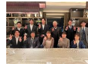
[象山未来塾の様子]