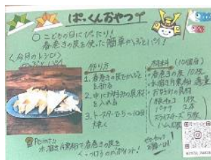
[アレルギーに配慮したおやつレシピ]

令和5年度においては、食物アレルギーをもつ子どもに配慮したお菓子のレシピを検討し、おやつ教室を実施する事業や、心の孤立のリスクがある子どもと大人をマッチングするバディプログラムを実施する事業、学内で自ら関心がある取組について学生同士が相談できる場や情報の提供、学生同士のつながりを提供する事業、子どもを対象に自らの関心事を表現できるよう哲学対話やアートワークによるアプローチを行う事業を採択した。