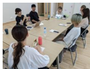
[バディプログラムキックオフミーティング]